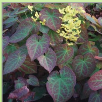
Epimedium p. 'Frohleiten' ( bispehue )

Lysforh.: ○▶ Blomst: gulgrøn i maj-juni Højde: 5 cm Antal pr m2: 16 Danner et fint grønt tæppe, nøjsom og tørketålende, stedsegrøn.