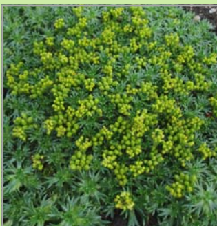
Azorella t. 'Elliotts Variety' ( gummipude )

Lysforh.: ○ Blomst: rød i maj-juni Højde: 10 cm Antal pr m2: 16 Nøjsom og langsom i vækst.