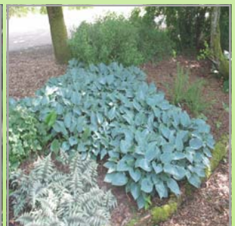
Hosta i soter ( se Hosta Guide )

Lysforh.: ○▶ Blomst: purpursort i juni-juli Højde: 60 cm Antal pr m2: 6 Anderledes løv med mørke felter, blomsten farver giver en god kontrast til den lyse granitskærve.