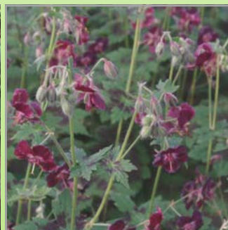
Geranium pha. 'Samobor' ( bølgekrønet storkenæb )

Lysforh.: ▶ Blomst: gul i maj-juni Højde: 15-20 cm Antal pr m2: 6 Blandt de mest stabile, etablere sig langsomt men sikkert, meget lidt renholdelse.