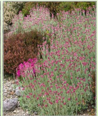
Antennaria dioica 'Rubra' ( Kattefod )

Lysforh.: ○▶ Blomst: hvid Højde: 5 cm Antal pr m2: 12 Flotte dekorative røde frøstande og med overvintrende løv. Hårdfør