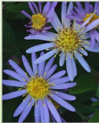
Aster ageratoides 'Asran' ( Asters )

Lysforh.: ○ Blomst: gullig/blågråt løv. Blomstre i juni Højde: 20 cm Antal pr m2: 9 Utrolig nøjsom, nem og tørketolerant.