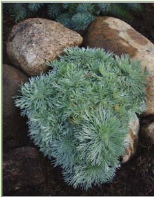
Artemisia sch. 'Nana' ( Bynke )

Der bruges som aldrig før belægningssten og granitskærver i de danske haver og forhaver. Planterne har måttet vige pladsen til for beton, knust granit og sten. Forventningen og ønsket om at undgå vedligeholdelse koster dels mange penge og er resultatet minder mest om en offentlig parkeringsplads. Helhedsindtrykket vil ændre sig markant, hvis man vælger at supplere med gode velegnede stauder. Også uden at det går udover vedligeholdelse.