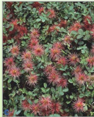
Acaena m. 'Kupferteppich' ( Tornnød )

Lysforh.: ○ Blomst: lys blå i oktober-november Højde: 70 cm Antal pr m2: 6 Sen blomstrende, velegnet til større arealer, hurtig voksende